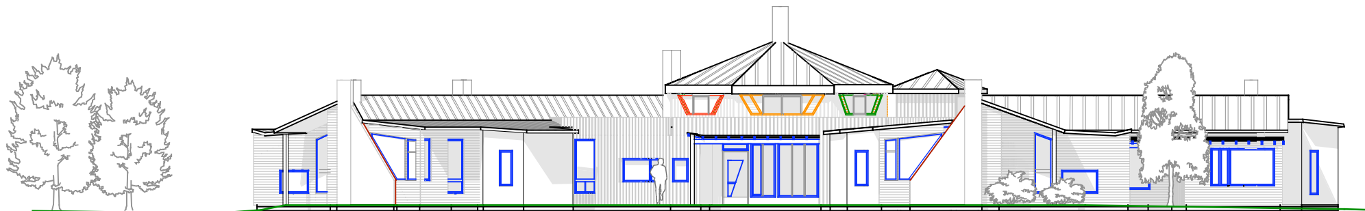
FS 1 : 200