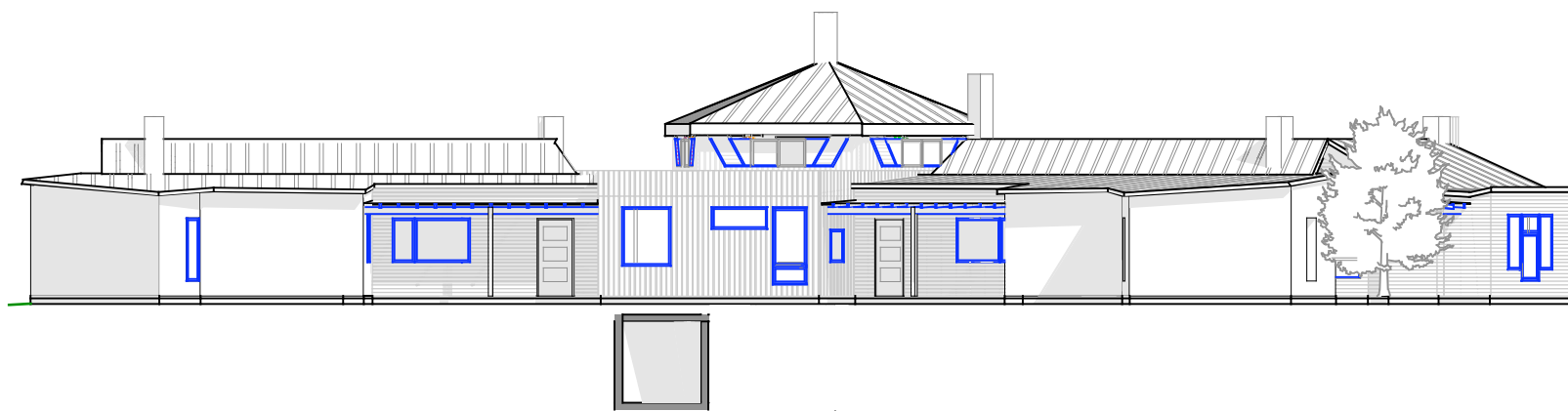
FN 1 : 200